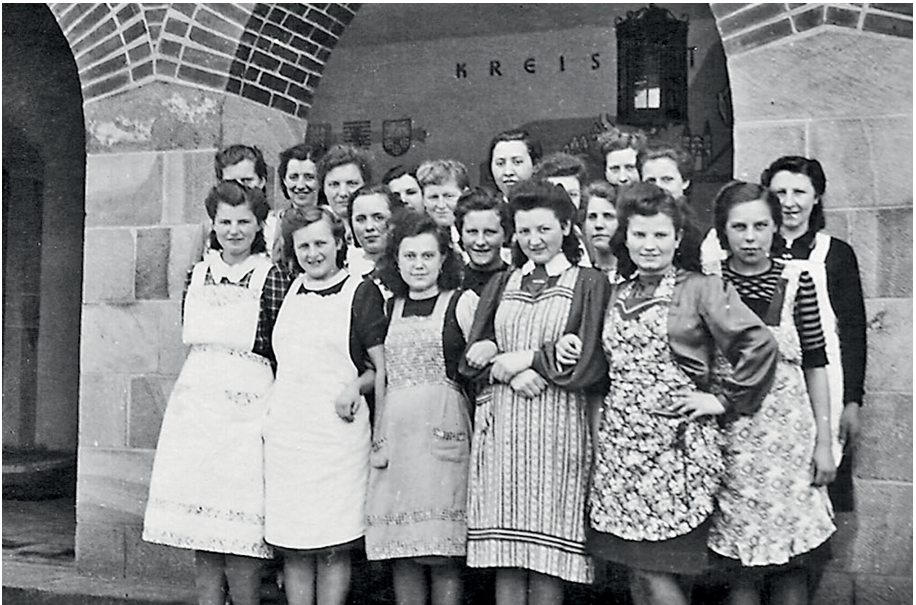
Fotos der Lehrküche der Berufsschule Emsdetten und der Kochklasse des Jahres 1938/39, Fotograf unbekannt, entstanden vermutlich zur Eröffnung im Jahr 1939. Quelle: Privatbesitz.